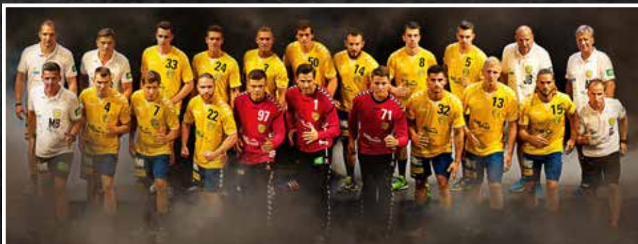
Mannschaftsfoto der 3. Herrenmannschaft