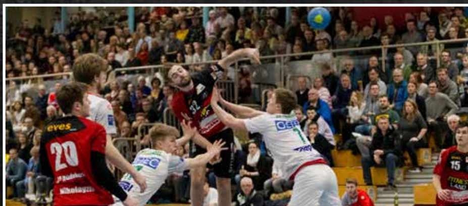
Szenen vom Spiel gegen SC Magdeburg II