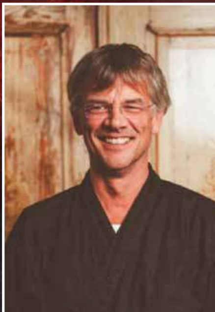
Geschäftsführer Waremode GmbH